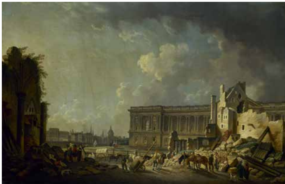
Ил. 6. Пьер-Антуан Демаши. Освобождение колоннады Лувра Ок. 1756 г. Музей Карнавале (P1499)