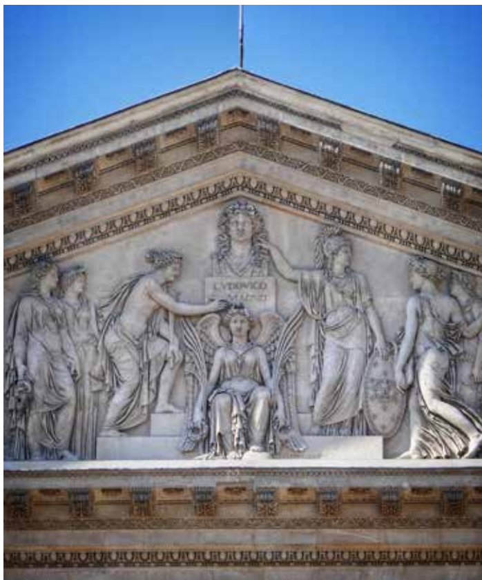
Ил. 2. Франсуа-Фредерик Лемо. Минерва, музы и Виктория коронуют Людовика XIV. Фронтон восточного фасада Лувра Ок. 1808/1815 г.

связанной с актуальными политическими вопросами. В середине XVIII в. Жак-Франсуа Блондель, автор известного многотомного труда «Французская архитектура», в котором были опубликованы многочисленные нереализованные проекты дворца, меланхолично замечал, что «со времени постройки его первого здания утекло уже много времени, несколько правлений небрежения и заброшенности прерывали его историю» [Blondel 1756: 1].