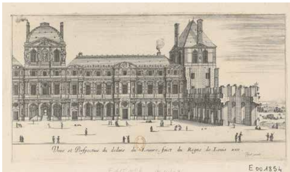
Ил. 3. Израэль Сильвестр. Вид и перспектива внутреннего фасада Лувра, построенного в правление Людовика XIII. 1650 Национальная библиотека Франции (IFN-53210938)

2002: 332]. В этих гравюрах старинные, нередко полуразрушенные строения соседствуют с прекрасными образцами современной культуры, величественные дворцы и соборы выделяются на фоне природы. Среди них есть и ряд изображений Лувра, вписывающихся в этот общий образ, например, гравюра «Вид и перспектива внутреннего фасада Лувра, построенного в правление Людовика XIII» (ил. 3). На ней изображена та часть западного крыла Квадратного двора, которая была возведена в правление этого монарха, и начатое при нем же северное крыло, изображенное не только недостроенным (каковым оно и оставалось к тому моменту), но уже имеющим признаки руины — потрескавшуюся кладку и выросшие на стенах траву и кусты. Этот образ носит существенный политический окрас, поскольку работы по благоустройству дворца, которые велись при Людовике XIII, были прерваны его смертью и начавшейся Фрондой — прекрасное здание, создаваемое заботами французских королей, грозило превратиться в руину вследствие бунта подданных.