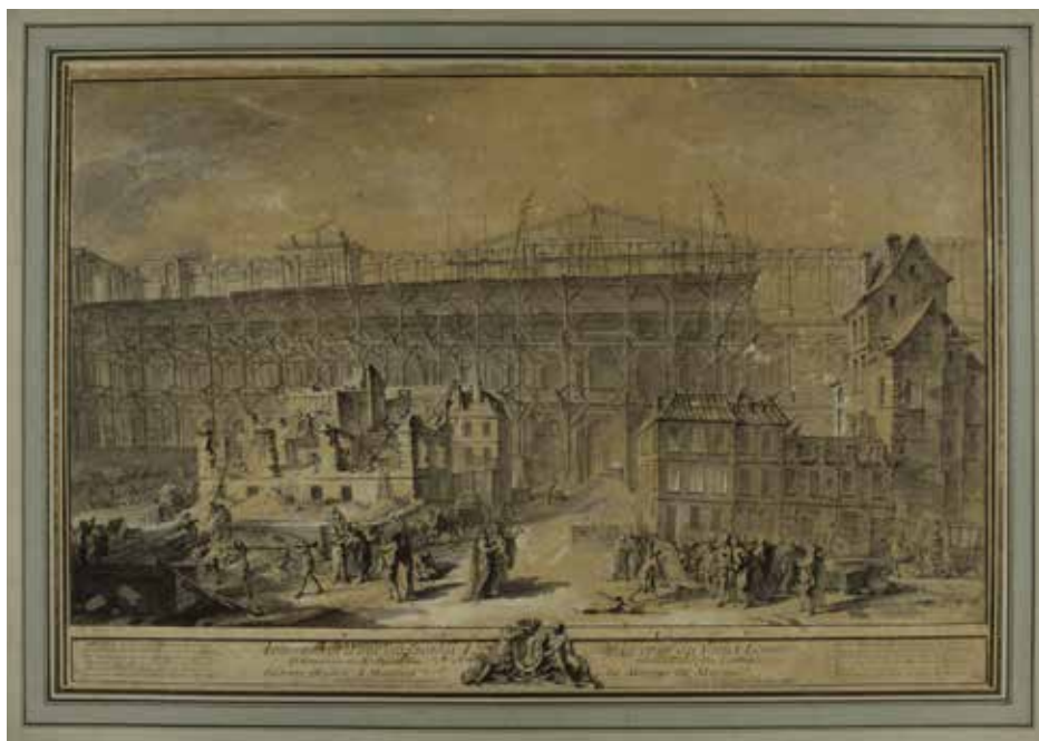
Ил. 5. Жорж-Франсуа Блондель. Завершение одного из фасадов Лувра в феврале 1755 г. и разрушение зданий, остававшихся в его внутреннем дворе. Ок. 1755. Музей Карнавале (D.6060)

всех изображенных Демаши строительных работ (а он много раз обращался к этой теме) именно образ Лувра приобрел особое символическое значение. Художник не пытался задокументировать реальный ход работ, он использовал сложившийся интерес к судьбе дворца и, можно добавить, нарратив о его недостроенности для того, чтобы сделать его «символом сложного строительства цивилизации» [Williams 2020: 24]. Но символическое освобождение мыслится им и в другом ключе — сделать дворец открытым взгляду, доступным для рассматривания. Эта идея, соответствовавшая новым градостроительным практикам, применявшимся в Париже с XVII столетия, имеет особое значение в случае с Лувром, поскольку отражает требование публичного доступа к тому, что считается национальным достоянием, которое нашло отражение и в предшествующих обсуждениях недостроенности дворца, и в его последующей судьбе как первого публичного государственного музея. Лувр на этих полотнах совсем перестает быть столичной королевской резиденцией, но существует как символ культурного развития, о котором власть заботится ради нации.