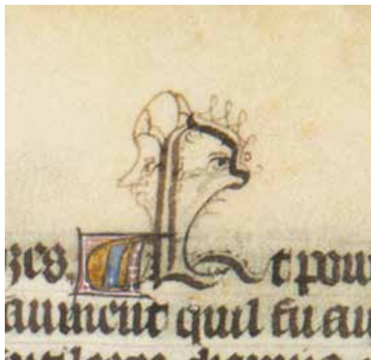
Ил. 4. Jean Petit. Discours pour la justification de Jean sans Peur, duc de Bourgogne. BNF. Ms. fr: 5733. Fol. 66