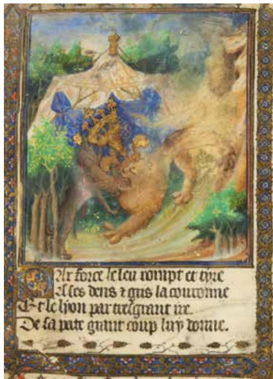
Ил. 1. Jean Petit. Discours pour la justification de Jean sans Peur, duc de Bourgogne . BNF. Ms. fr. 5733. Fol. 2v

Волк с силой тянет и срывает Своими зубами и когтями корону, А разъяренный лев Наносит ему лапой страшный удар 24 .