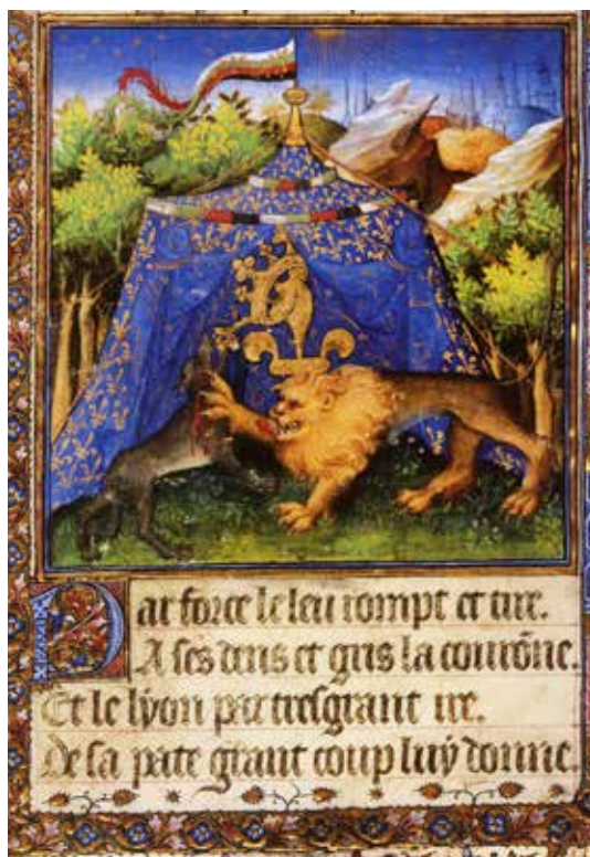
Ил. 2. Jean Petit. Discours pour la justification de Jean sans Peur, duc de Bourgogne. Wien, Österreichische Nationalbibliothek. Ms. 2657. Fol. 1v

отношение и ко второй важной теме, затронутой в «Оправдании», — к теме колдовства, которым якобы увлекался Людовик Орлеанский.